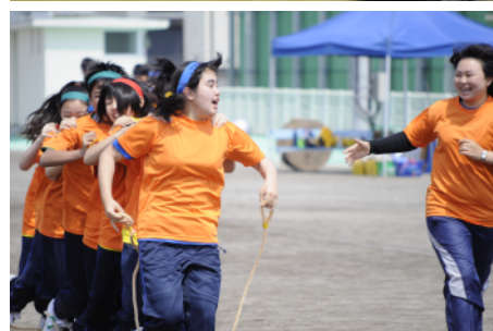
合唱の様子(上)と百足競走(下)の様子