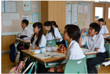
授業中にグループで説明を聞く様子(中2)