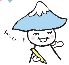
イメージキャラクター ふじみちゃん

富士見中学校の生徒募集が始まりました。入試手続きは簡単です！でも心配という方や受験させようか迷っているという保護者の皆様の声にお応えするため、入試相談会を開きます。お気軽にご参加ください。