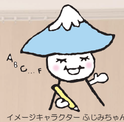
イメージキャラクター ふじみちゃん